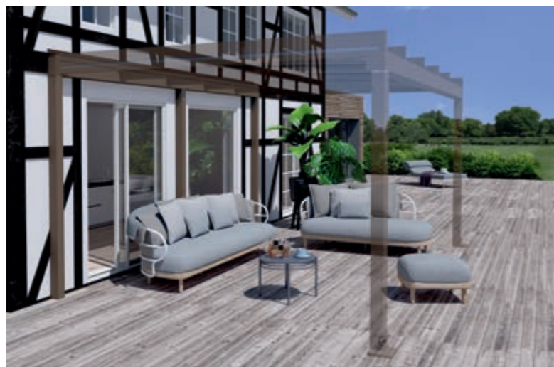
Voorbeeld vakwerkgevel, Dragende Wandaansluiting en Terrazza Pure