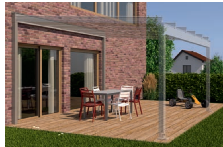
Voorbeeld baksteengevel, Dragende Wandaansluiting en Terrazza Semptra