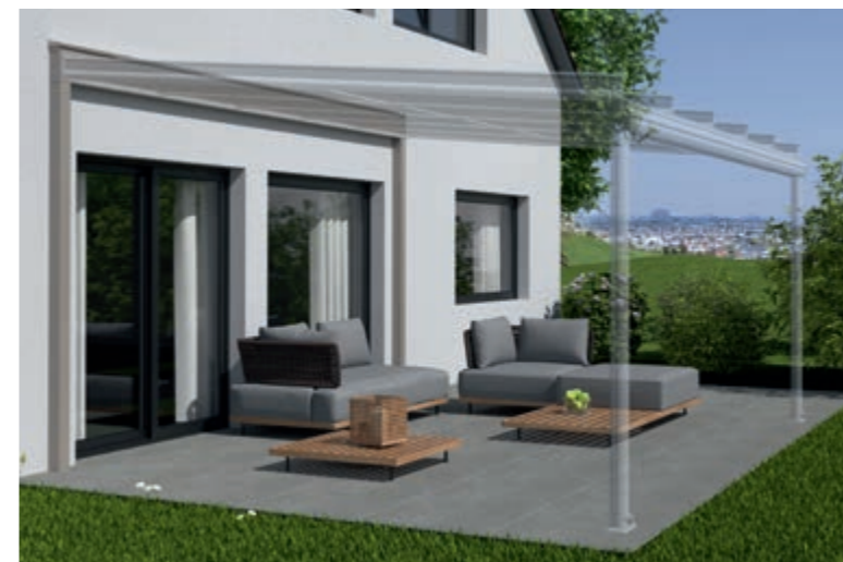
Voorbeeld sterk geïsoleerde huisgevel, Dragende Wandaansluiting en Terrazza Originale