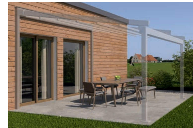
Voorbeeld prefabhuis op houten skelet, Dragende Wandaansluiting en weinor PergoTex II